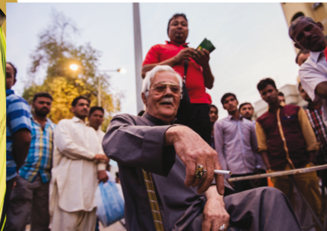
مسن بحريني يجلس وسط مجموعة من الأسويين حيث تبايع تذاكر «حظ» بالاصيب» في سوق المنامة