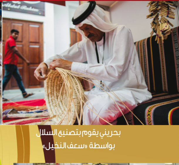
بحريني يقوم بتصنيع السلال بواسطة «سعف النخيل»