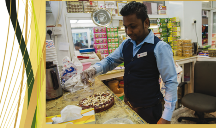
إعداد الحلوى البحرينية في إحدى المحلات التجارية في سوق المنامة والتي تعتبر من أشهر الحلويات في دول الخليج العربي.