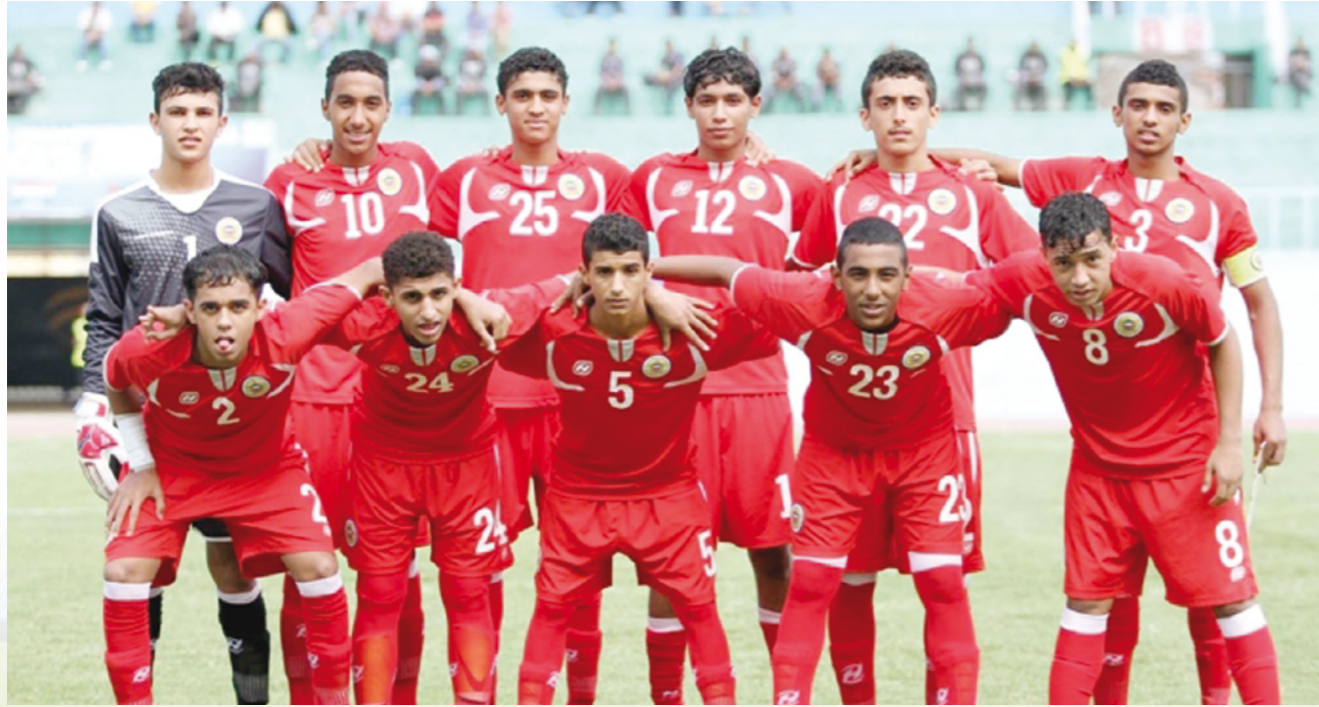
المنتخب الوطني للشباب

وسيواصل المنتخب الوطني للشباب سلسلة استعداداته للبطولة الآسيوية بخوض مباراتين وديتين خلال شهر مايو/أيار الجاري مع منتخبي تانزانيا وسنغافورة. قبل أن يشارك في بطولة ودية تستضيفها إحدى مدن إسبانيا، وستشارك فيها منتخبات عالمية مثل البرازيل، إسبانيا، رومانيا، الصين، كولمبيا وقطر الحائزة على لقب النسخة الأخيرة من بطولة كأس الأمم الآسيوية للشباب تحت ١٩ عاماً.