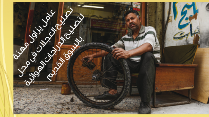
تصليح العجلات في محل تصليح العجلات الهوائية بالسوق القديم