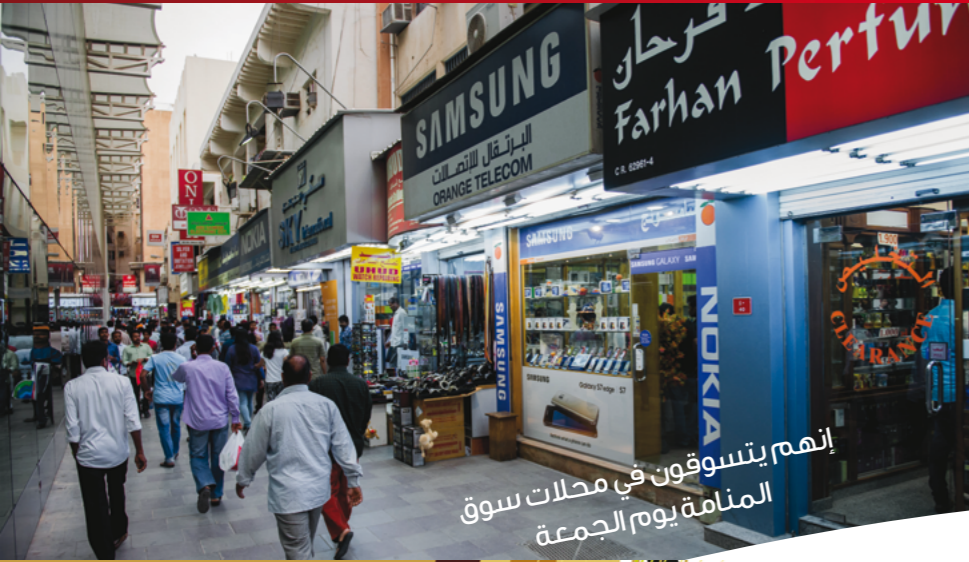
إنهم يتسوقون في محلات سوق المنامة يوم الجمعة