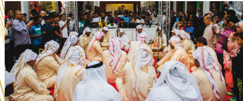
الفن الشعبي البحريني في سوق المنامة القديم، والجماهير من مختلف الجنسيات يستمتعون بأهازيجنا المبدعة