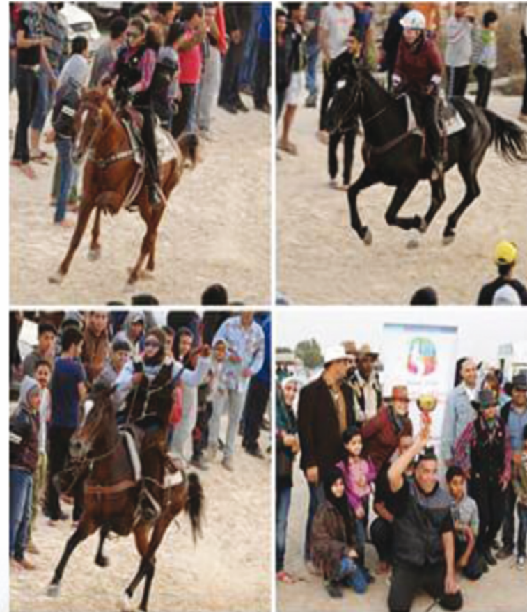
أول سباق شعبي للسيدات - سباق بر سار الشعبي

وحدث في إحدى المرات أنه قد تم توجيه السؤال التقليدي إلى القتل الذي استيقظ فجأة مذعوراً فقد كان مغشياً عليه ولم يكن ميتاً، فما كان من المحامي إلا أن طلب تخفيف العقوبة طالما أن الرجل لم يمت، غير أن المحكمة رفضت طلب الدفاع وقررت أن القتل يعتبر ميتاً طالما لم يجب على سؤال الضابط: أيها القتل من قتلك ؟ !!