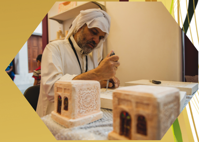
بحريني يقوم بنقش الجبس وزخرفة وسط سوق العاصمة القديمة ضمن مهرجان الحرف اليدوية