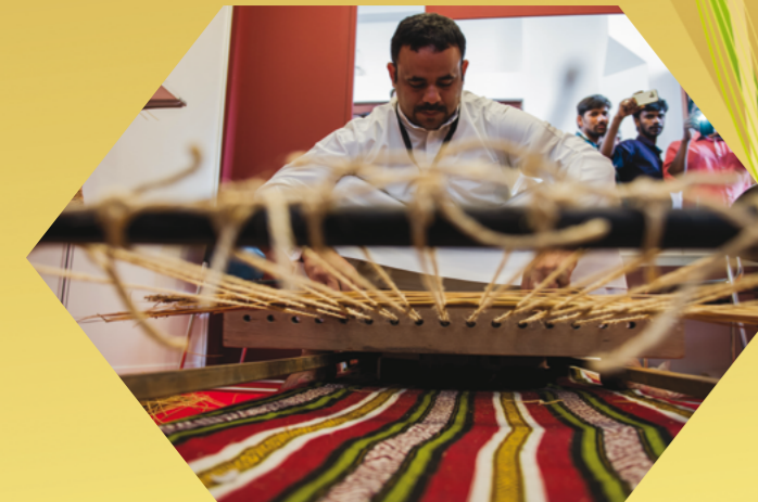
بحريني يقوم بصناعة «السجاد» ضمن مهرجان «حرفنا»