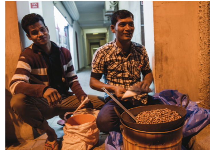
آسيوي يبيع الفول السوداني في إحدى شوارع سوق المنامة