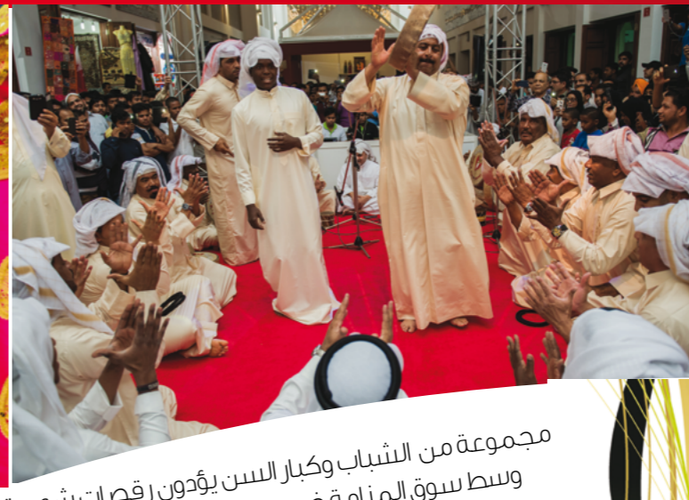
مجموعة من الشباب وكبار السن يؤديون رقصات شعبية وسط سوق المنامة ضمن مهرجان الحرف اليدوية