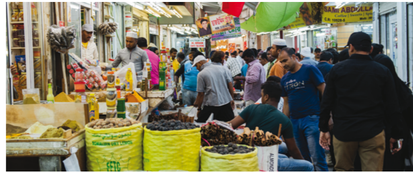
المكسرات والتوابل في إحدى المحلات بسوق المنامة

يعتبر سوق العاصمة البحرينية «المنامة» من المعالم السياحية الشهيرة في مملكة البحرين وهو يقع بالقرب من المعلم السياحي باب البحرين، ويحتوي السوق على عدد كبير من المحلات التي تعرض مجموعة متنوعة من الملابس والأحذية والمحلات التي تباع الحلويات والبهارات. يتواجد في السوق عدد من محلات الذهب مثل مدينة الذهب. كما يوجد لفيف من المقاهي التي تقدم المشروبات المحلية والوجبات الخفيفة للمتسوقين، وقد شهد السوق مؤخرًا مهرجاناً للحرف اليدوية تحت عنوان «حرفنا».