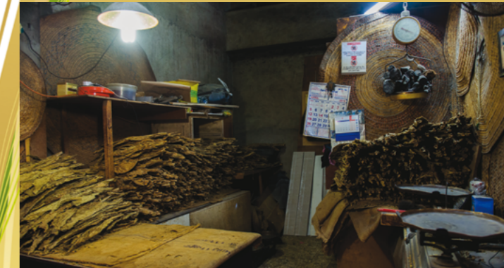
محل لبيع منتجات التبغ «التتن» في سوق المنامة