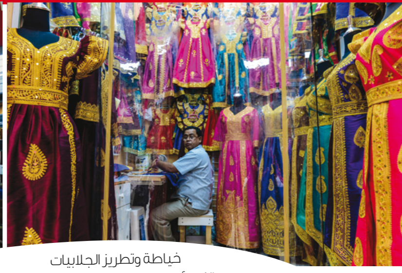
خياطة وتطوير الجلابيات النسائية في إحدى المحلات العتيقة