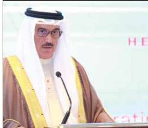
المسلم: للمبادرات الوطنية أهمية بالغة في دعم الأفراد من ذوي العزيمة

وأكد معاليه على أن تمكين الأفراد من ذوي الاحتياجات الخاصة يأتي ضمن سلم أولويات مجلس النواب، منوهاً إلى أن المجلس بحث أكثر من ٥٥ موضوعاً يتعلق بشريحة ذوي الاحتياجات الخاصة، ومشجداً على ديمومة التعاون بين السلطتين التشريعية والتنفيذية لتحقيق التطلعات والأهداف المنشودة، بالإضافة إلى توفير الخدمات اللازمة