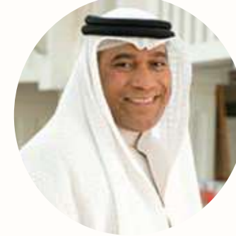
أ.د البروفيسور علي عمران