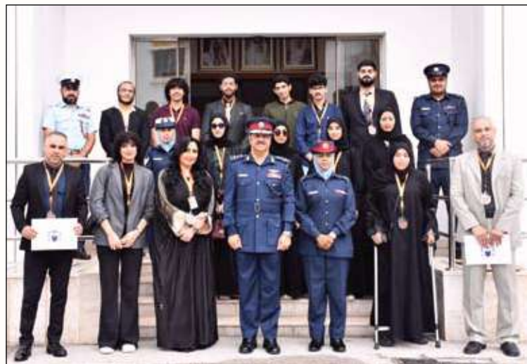
الجامعة الاهلية تحصل على المركز الأول في الدفاع المدني