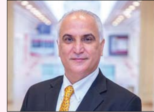
البروفيسور مختار الهاشمي